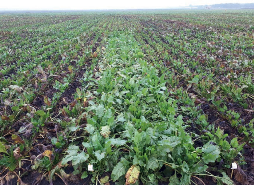
Het aanbod van rassen met een hoge bladgezondheid cercospora neemt de komende jaren naar verwachting toe

Als hulpmiddel bij het bepalen van de benodigde resistenties wordt bij de digitale zaadbestelling via het ledenportaal van Cosun een aanbeveling gegeven voor de benodigde resistentie(s). Op basis van de gegevens die over het perceel bekend zijn, wordt aangegeven of rhizoctonia-, bieten-cysteaaltjes- en/of aanvullende rhizomanieresistentie raadzaam is. Binnen dat resistentiesegment is het vervolgens zaak om na te gaan welke raseigenschappen voor het perceel