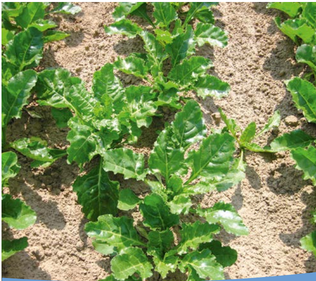
Foto: Bieten tussen de rijen zijn meestal onkruidbieten.

De doseringen van de middelen in de LDS-combinatie hangen af van zowel het stadium van de bieten als van de onkruiden. Verder heeft het weer rondom de toepassing invloed op de effectiviteit van de toegepaste onkruidbestrijdingsmiddelen en de verdraagzaamheid van de bietenplanten. Houd hier bij het kiezen van de doseringen rekening mee. De nieuwe applicatie IRS-LIZ-onkruidbeheersing op www.irs.nl kan hierbij helpen.