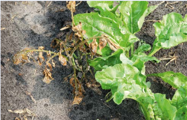
Goede bestrijding van aardappelopslag zonder schade aan bietengewas met metamitron.