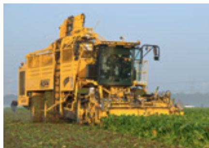
Foto 6. De kleinste en de grootste bunkerrooier op Beet Europe hebben een gelijke maximale wiellast. Bij Ropa (links) is dat gerealiseerd door een betere gewichtsverdeling over alle wielen.

Alle rooiers zijn gewogen met volle en lege bunker (zie tabel 2). Opvallend is dat de kleinste en grootste bunkerrooier (foto 6), ondanks een groot verschil in gewicht en bunkerinhoud een gelijke hoogste wiellast hebben. Dat onderschrijft het belang van een gelijkmatige gewichtsverdeling. Ropa scoorde op dit punt het best. Ook op Beet Europe viel op dat verlaging van bodemdruk belangrijk is bij het bietentransport met steeds grotere kippers. Daarbij geldt dat er steeds meer