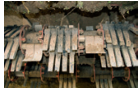
Foto 1. De Grimme FM300-ontbladeraar heeft geen kopmessen en verwijdert de laatste bladresten door intensief poetsen. Dit systeem past ook op een bunkerrooier.

In de test (zie tabel 1) werden de verschillen vooral gemaakt door de juiste instellingen voor het testperceel en attent reageren van de rooierchauffeur. Dat was duidelijk te zien bij het kopwerk. De Grimme Rootster met voorop het FM300 ontbladersysteem (foto 1) had door zijn techniek een kopverlies van slechts 1 euro per hectare. De Ropa euro-Tiger en de Vervaet Beet Eater 625 konden met goed afstellen van de scalpeurs met kopmessen de verliezen bij het koppen beperken tot 7 euro per hectare. De hoogste verliezen