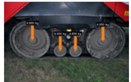
Foto 7. Het gewicht op de rupsen van de Grimme Maxtron was zeer gelijkmatig verdeeld. Van voor naar achter rustte er op de loopwielen respectievelijk 25%, 24%, 25% en 26% van het totale gewicht op de rups. In combinatie met het grote contactoppervlak van de rupsen resulteert dit in een snellere afbouw van de bodemdruk dan onder de banden van bunkerrooiers.

banden op lage bandspanning nodig zijn om dit bodemvriendelijk te houden. De Grimme Maxtron is de enige rooier op rupsen. Opvallend is hoe gelijkmatig de gewichtsverdeling is over de rollen van dit rupssysteem (foto 7). In combinatie met de relatief lagere last per loopwiel verklaart dit ook waarom de bodemdruk onder zo'n rups sneller afbouwt dan onder de banden van bietenrooiers.