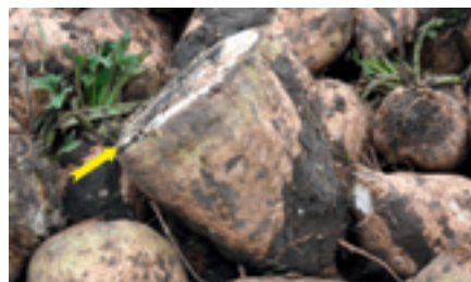
Foto 2. In het testperceel lagen de spuitsporen overdwars. Bij het passeren van de spuitsporen hebben enkele rooiers de bieten met de klepels van de ontbladeraar al stevig gekopt, zoals op de foto. Een alerte chauffeur minimaliseert dit.

Postbus 32, 4600 AA Bergen op Zoom Telefoon: 0164 274400 Fax: 0164 250962 E-mail: irs@irs.nl Internet: www.irs.nl Eindredactie: Annemarie Naaktgeboren